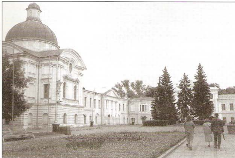
Katarina II:n matkapalatsi (1764-77).